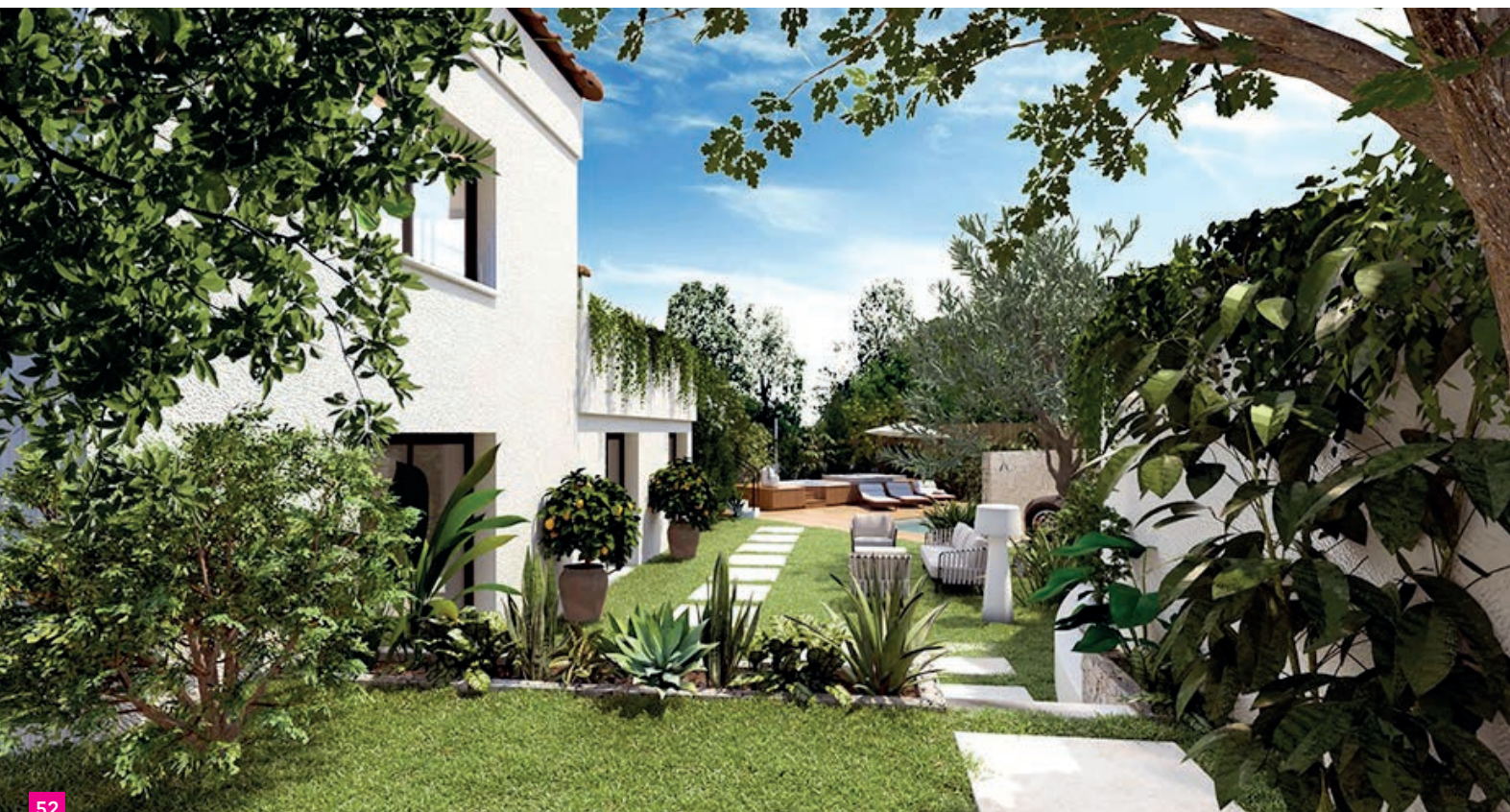
Proposition d'aménagement virtuel réalisée par Design Elementaire. Visuel 3D non contractuel.