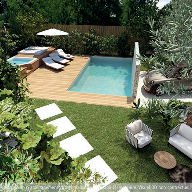
Proposition d'aménagement virtuel réalisée par Design Elementaire. Visuel 3D non contractuel.

Honoraires : compris à la charge de l'acquéreur de 5% (640.000 € hors honoraires)