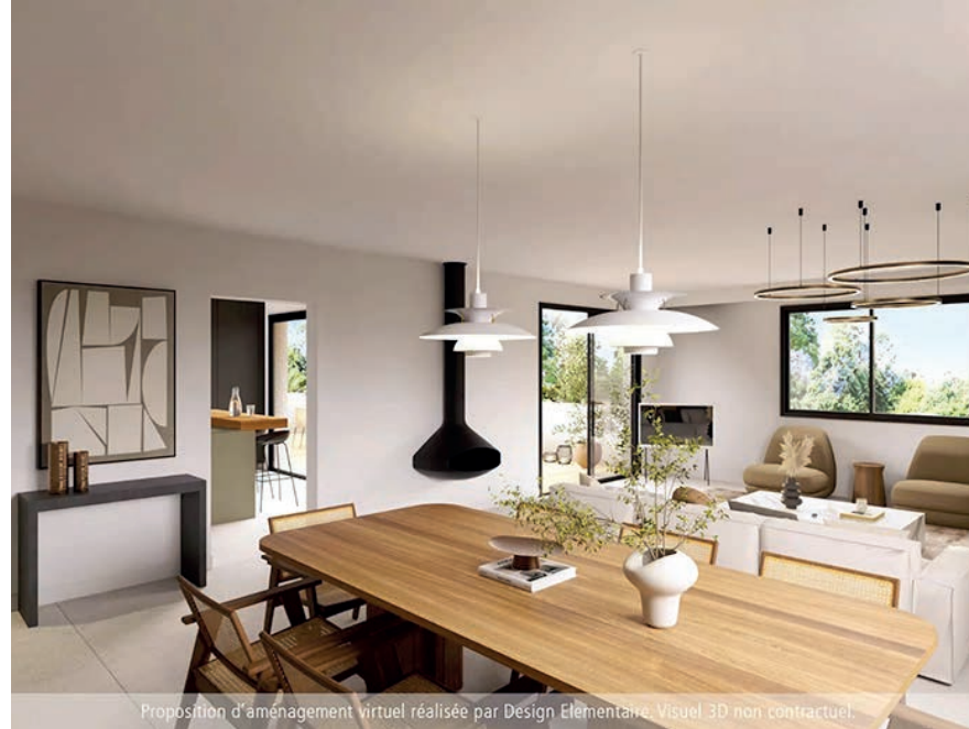
Proposition d'aménagement virtuel réalisée par Design Elementaire. Visuel 3D non contractuel.